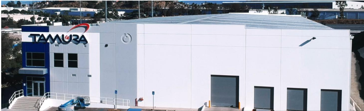
Tamura Power Technologies de Mexico SA, DEC. V. 第2工場 （設備投資金額約100万USD、建屋レンタル費用約50万USD/年、延べ床面積：約4000㎡）